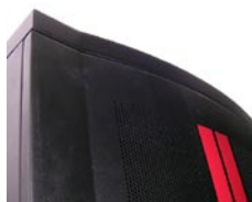
圓弧造型網狀設計