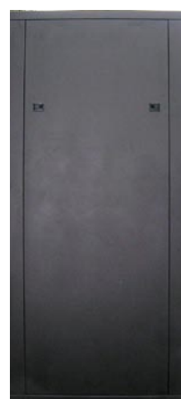
無螺絲可拆式側板