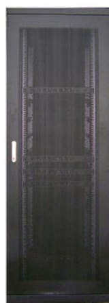
後門為鋁框式蜂巢孔門